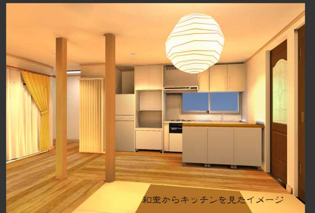
和室からキッチンを見たイメージ