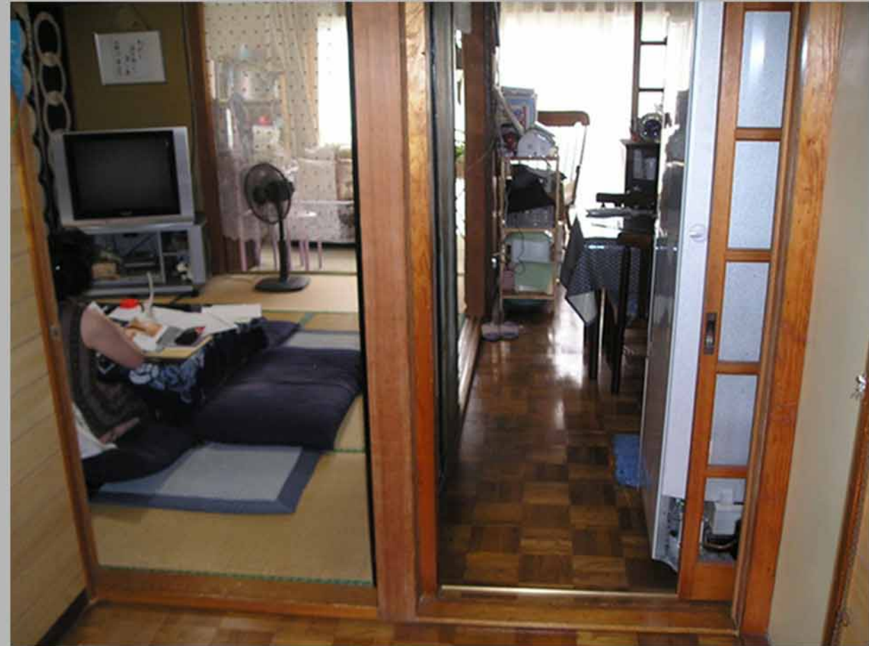
↑柱左側：和室 柱右側：台所