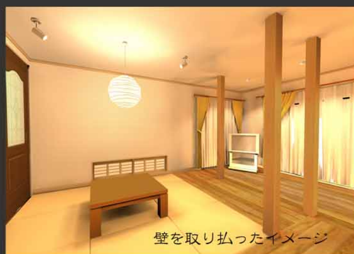
壁を取り払ったイメージ

パソコンのCGソフトを使って、改修後の様子をお客様がイメージしやすいようにご提案。