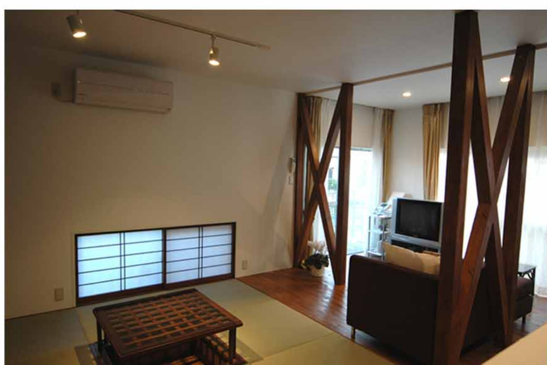
↑キッチンから和室を見て