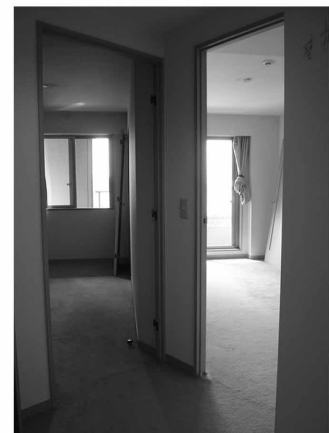
▲ 細かく仕切られた洋室。