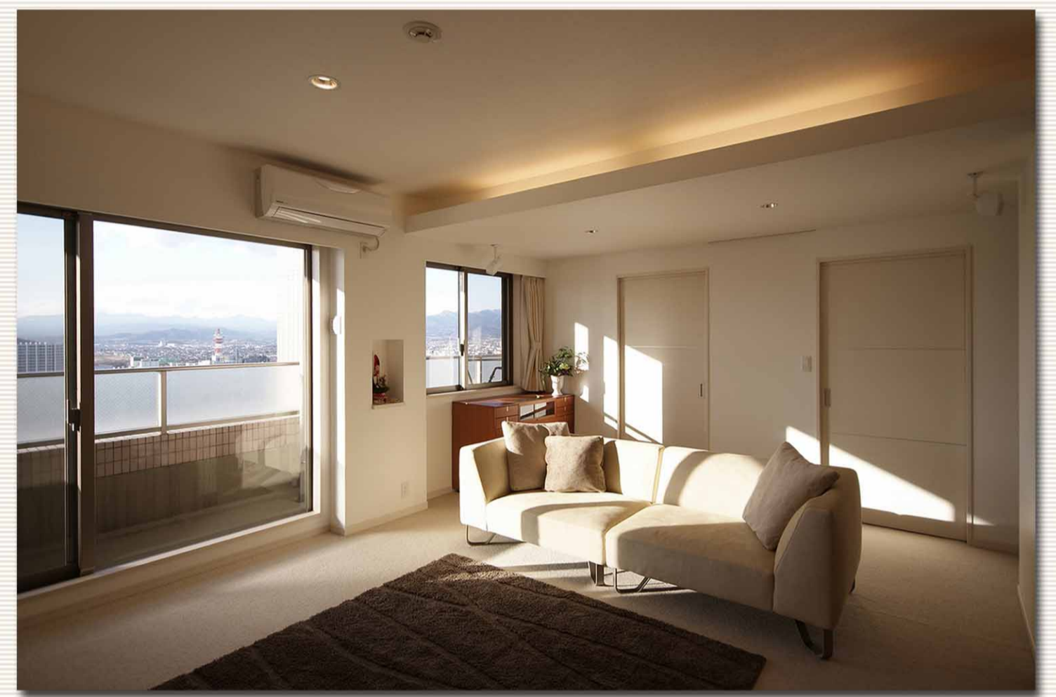
▲ 大きな開口部から山々を一望出来る。