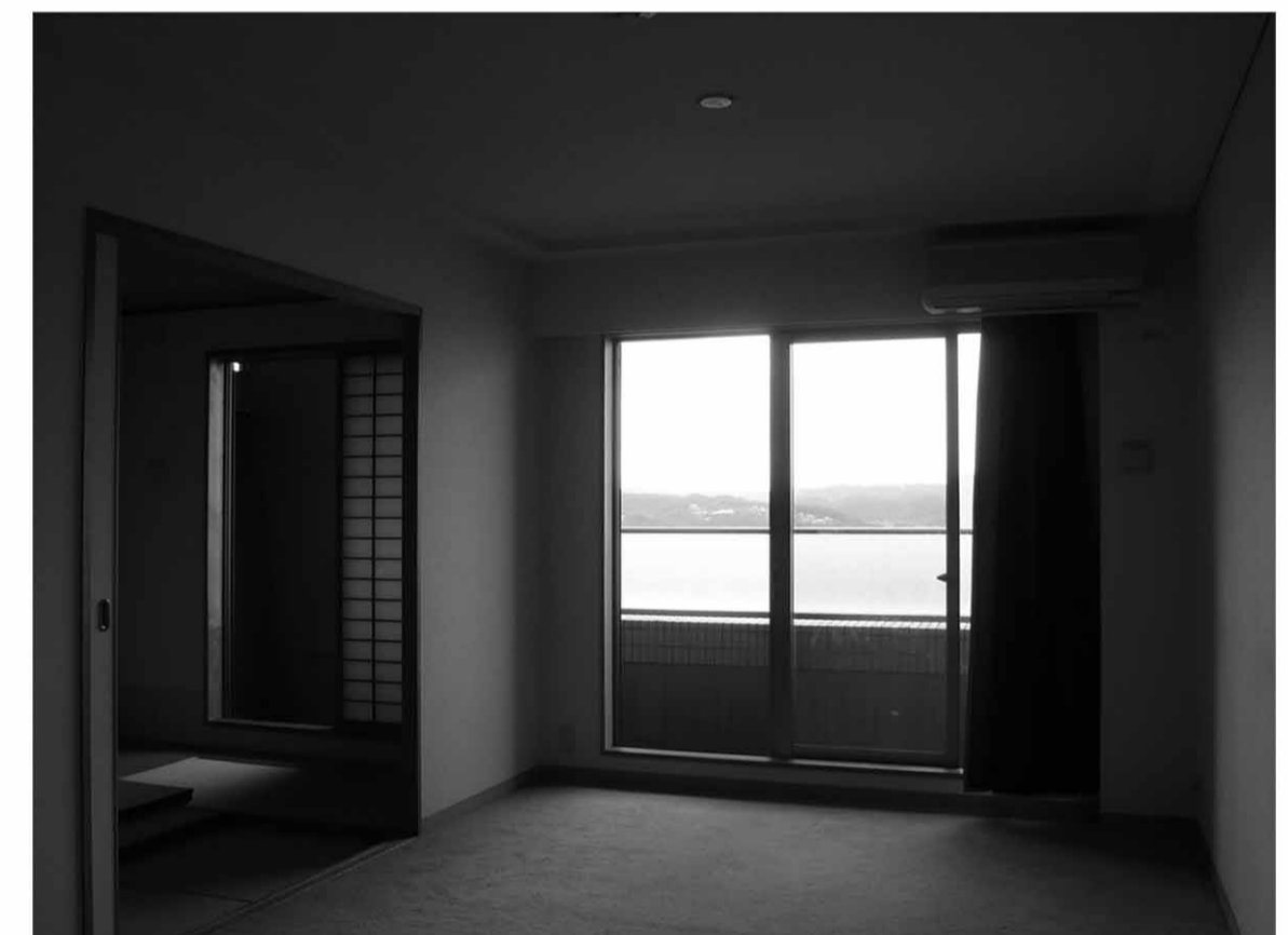
▲ ダイニングまで光が届かず、暗いイメージのリビング。