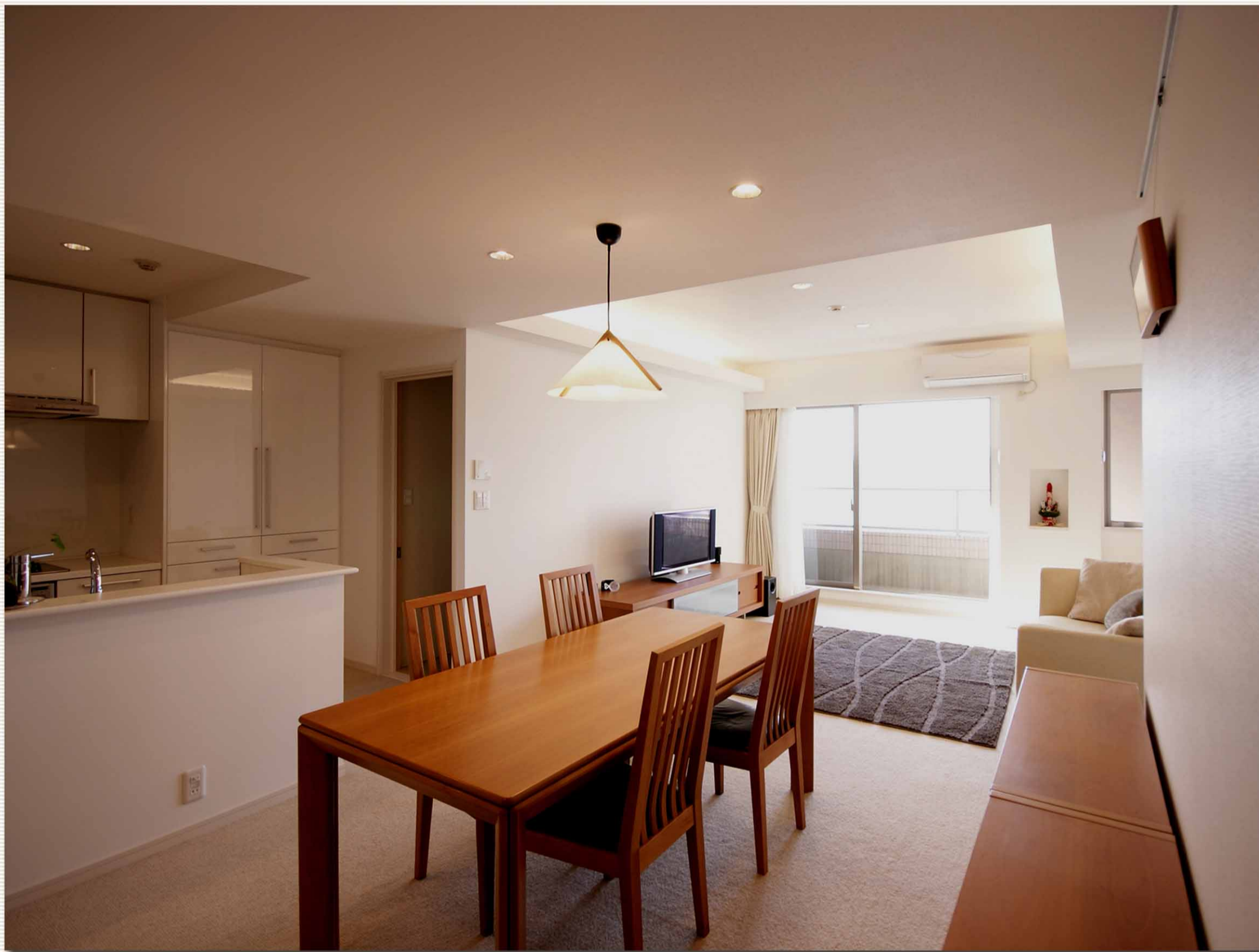
▲ 窓からの光が部屋の奥まで行き届くLDKに。

同マンションの別階で生活していたお施主様。子供が大きくなり手狭となったため、最上階へ住み替える事にされました。限られた空間しかないマンションで感覚的に広さを感じるために外（そと）の空間を内（うち）へと取り込む事に重点を置き、孤立していた部屋をひとつのLDKへと改装。自然と家族が集まる場所の確保に成功しました。