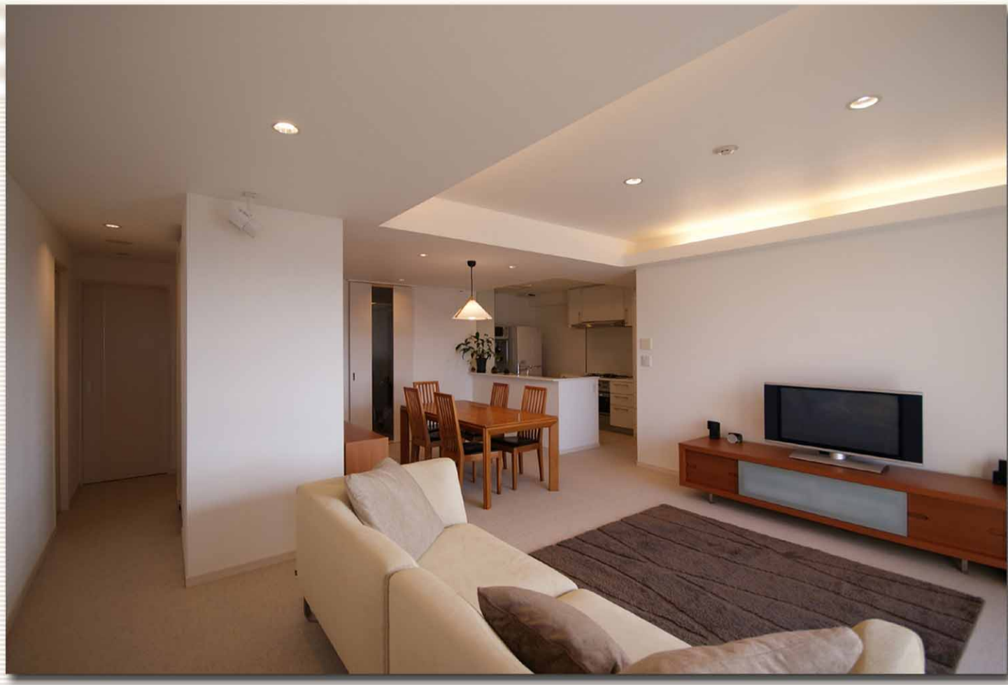
▲ 折り上げ天井が空間をさらに広く感じさせる。